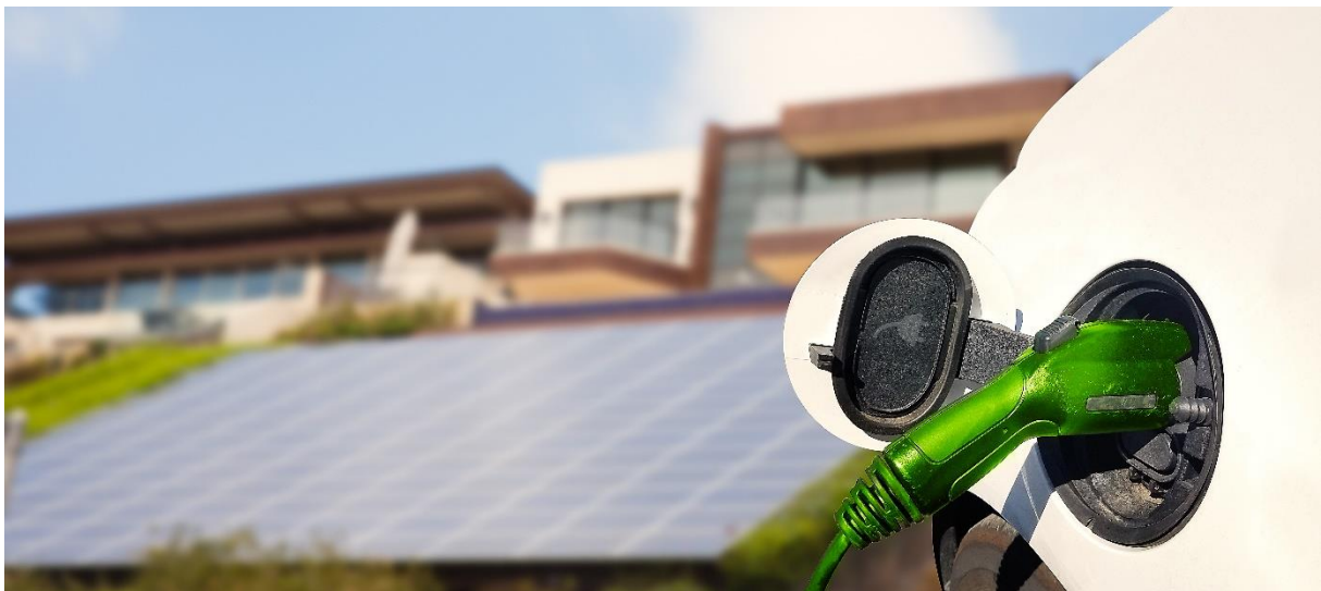
Abbildung 1: istock.com/stellalevi

Da stellt sich die Frage, wie der Solarstrom-Überschuss an einem sonnigen Campingtag in die Abendstunden transferiert werden kann. Die Lösung: Solar-Batterien. Aber was ist dabei zu bedenken und lohnt sich das überhaupt?